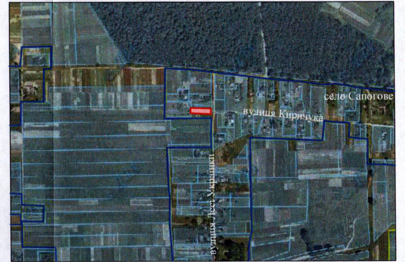
— межа населеного пункту с. Сапогове