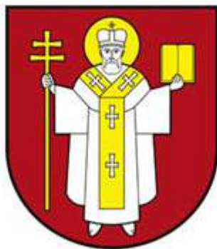
Герб Луцька з 2007 року.

Опис: «В щиті з заокругленою нижньою частиною (т.зв. іспанський) у золотому полі срібна гербова постать Святого Миколая у повному єпископському вбранні, босоніж. Золотом виділені основні єпископські відзнаки – німб, патериця, епітрахіль та Євангеліє. В правій руці Св. Миколай тримає патерицю у вигляді шестираменного Захисного (патріаршого) хреста, що символізує перемогу християн над силами сходу, захист перед нашествиями та морами, підкорення сил стихії. У лівій руці він тримає розгорнуту книгу, що символізує Євангеліє, захист Божих сил та покровительство наукам. Босі ноги символізують міфологічні функції управителя погодою та водною стихією»