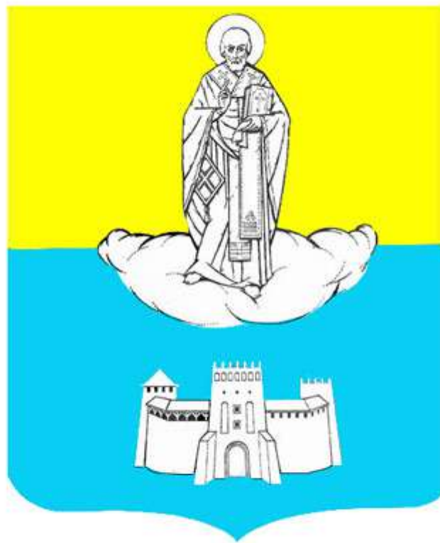
Герб Луцька з 1998 року.

Опис: « Основою герба є прямокутний щит; основа якого дорівнює 8/9 висоти загостреним виступом. Нижні частини щита заокруглені. Щит розділений на дві частини. У верхній частині на золотому тлі зображено явлення образу Святого Миколая, який благословляє місто. У нижній частині на голубому тлі – стилізоване зображення Луцького Замку, як символ неприступності міста.»