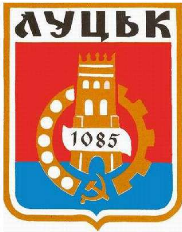
Герб Луцька з 1982 року.

Опис: «Герб имеет форму пересеченного снизу щита, обрамленного узкой золотой каймой. Верхняя часть красного цвета, нижняя синего. Цветовая гамма поля щита соответствует цветам Государственного флага УССР. В центре щита изображена въездная башня Луцкого замка, как символ мужества в борьбе с иностранными захватчиками. Башню окружает голубое кольцо, правую часть которого составляет подшипник, а левую – шестерня, которые символизируют развитие индустрии. В основании кольца находятся красные серп и молот, в центре серебром помещена дата "1085" - год первого упоминания о городе в летописи. В верхней части щита золотом начертано название города на украинском языке ЛУЦЬК».